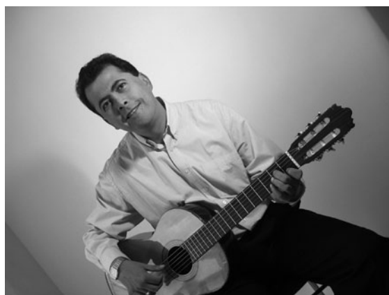
Ganador XIV Concurso Nacional de Composición “Leonor Buenaventura” 2011